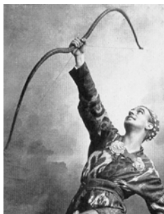
Adolf Bolm