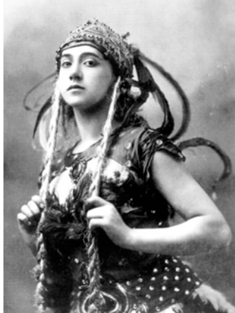
Tamara Karsavina